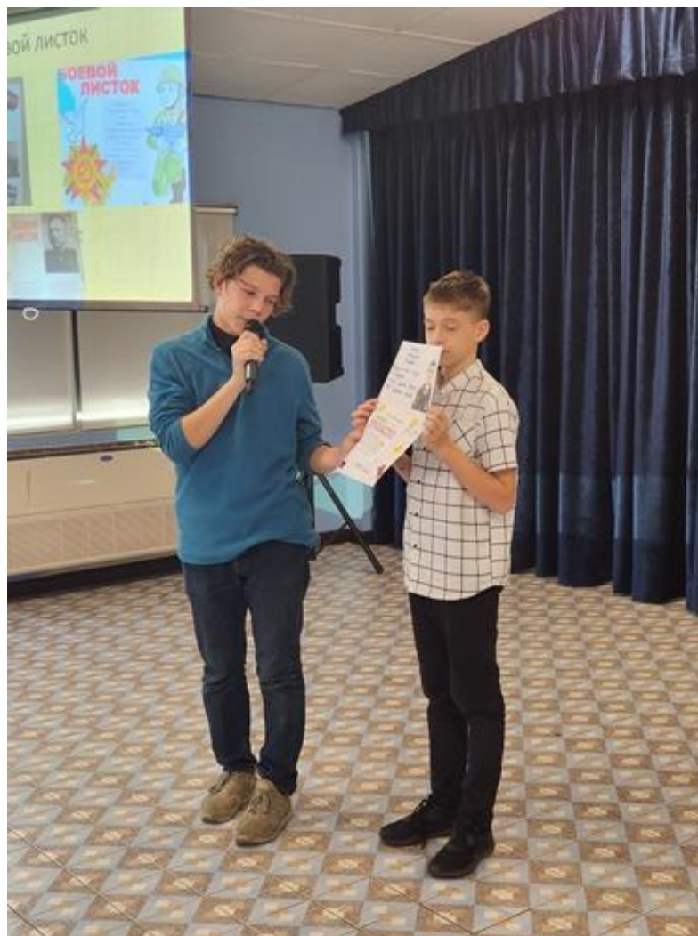
Мероприятие завершилось минутой молчания в память о погибших героях России.